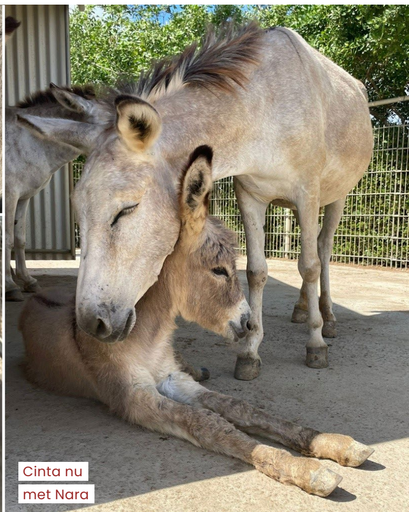
Cinta nu met Nara