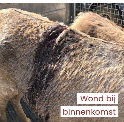
Wond bij binnenkomst

Op 20 oktober mochten we haar prachtige dochtertje Nara verwelkomen.