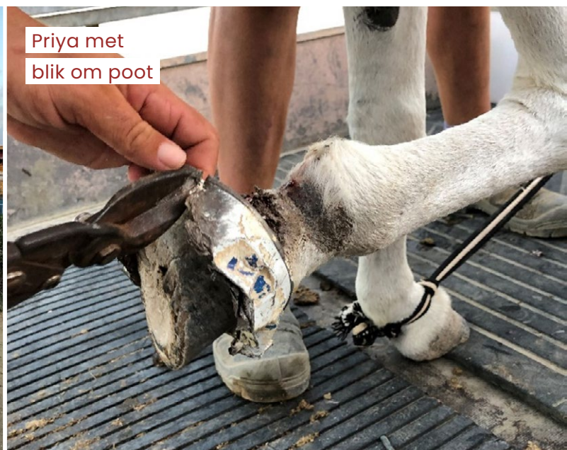
Priya met blik om poot