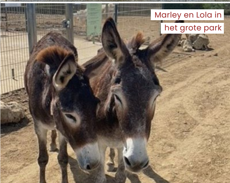
Marley en Lola in het grote park