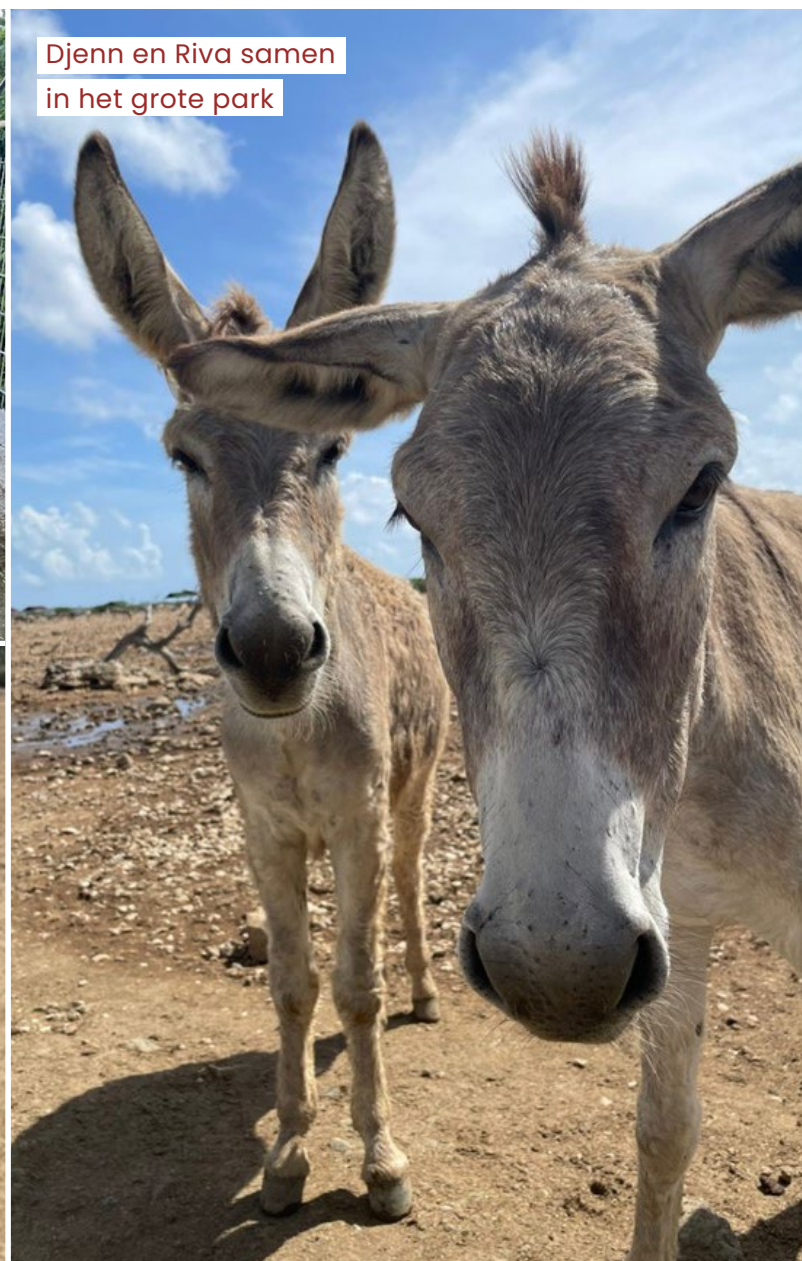
Djenn en Riva samen in het grote park