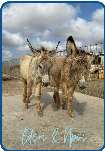
Edem & Novi