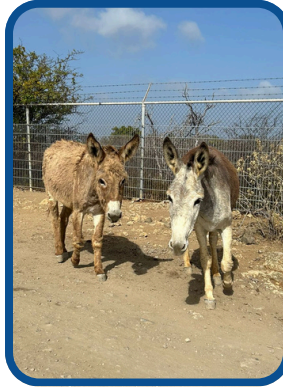
Nox & Doris